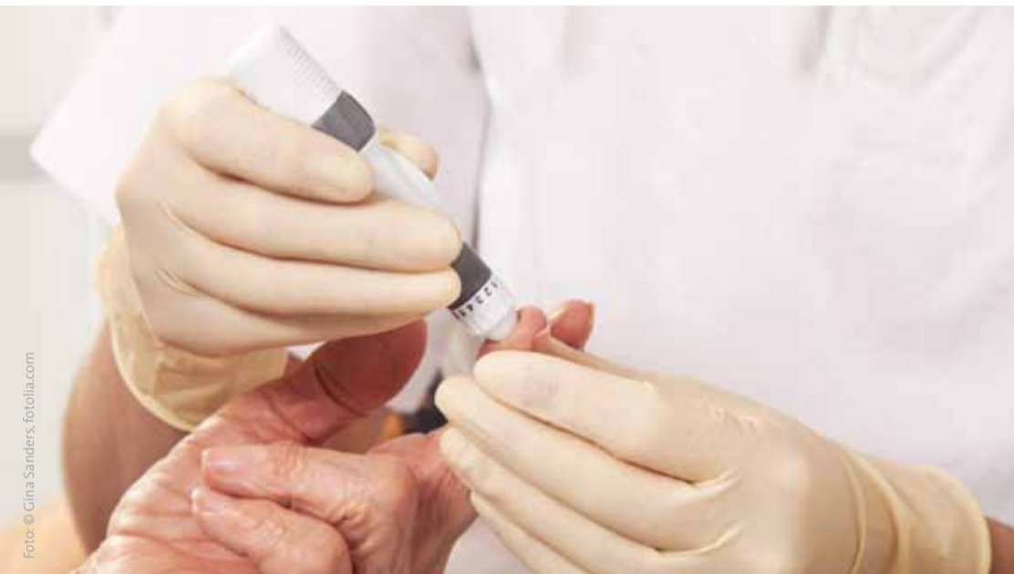
Der Blutzuckertest gehört zu den Leistungen, die ein Arzt den Pflegefachkräften einer Sozialstation übertragen kann.

SPRITZEN SETZEN , Verbände wechseln, Medikamente verteilen, Blasenkateter anlegen, Darmspülungen vornehmen, Puls und Blutdruck messen, Infusionen überwachen, Kompressionsstrümpfe anziehen und vieles mehr – das gehört zur medizinischen Behandlungspflege. Allen diesen Tätigkeiten gemeinsam ist: Es sind ärztliche Leistungen, die der Arzt aber delegieren kann. Und zwar ausschließlich an fachlich qualifiziertes Personal. Die Kirchlichen Sozialstationen leisten die Behandlungspflege seit jeher. Vor allem beraten wir qualifiziert und sicher in allen Fragen rund um die Behandlungspflege.