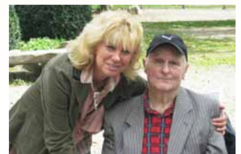
Wir betreuen jeden Kranken ganz persönlich.

men Spaziergänge, lesen aus der Zeitung vor. Wir aktivieren durch Gedächtnistraining, Seniorengymnastik, Sitztänze. Wir erzählen und knüpfen an Themen von „früher“ an. Freude und Anerkennung erleben, neuen Lebensmut gewinnen, angenommen sein – das sollen unsere Gäste bei uns finden. Daher bietet unsere Betreuung eine herzliche und