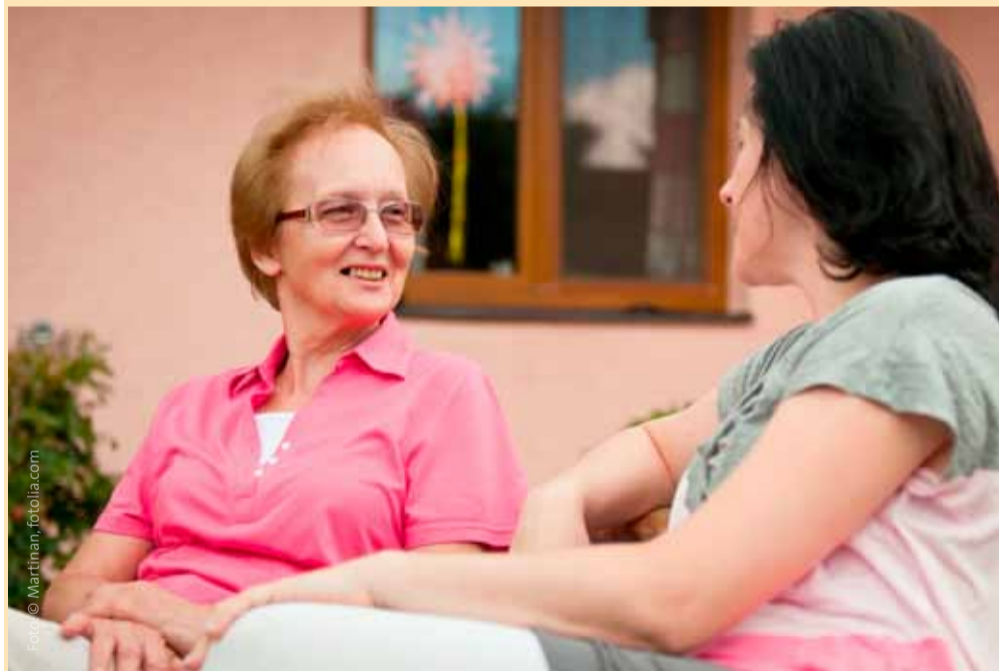
Offenheit hilft – und auch die Frage: „Was brauchst du?“

Die Psycho-Onkologie oder auch psychosoziale Onkologie* ist ein relativ junges Fachgebiet der Krebstherapie, das seit Anfang der 1980er-Jahre Beachtung findet. Als Pionier gilt der amerikanische Radiologe und Facharzt für Onkologie Dr. Carl Simonton. Er war der erste klassisch-medizinische Krebspezialist, der davon überzeugt