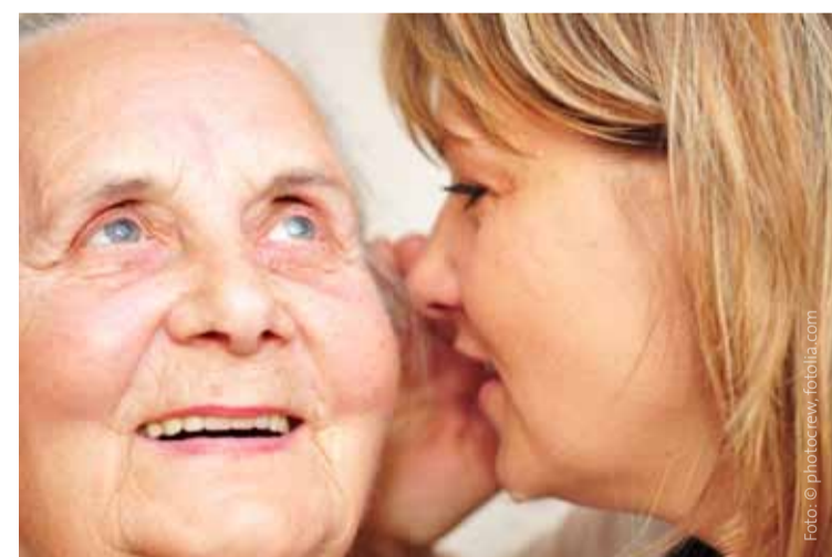
Das hebt die Stimmung: an gute Zeiten erinnern und über gemeinsame Erlebnisse sprechen.

Regel miteinbezogen. Die Angebote reichen von unterstützenden Einzel-, Paar- und Gruppengesprächen über Krisenintervention und kreative Angebote bis hin zur sozialrechtlichen Beratung. Die psycho-onkologischen Angebote in Krebsberatungsstellen, Akut- und Reha-Kliniken sind in der Regel