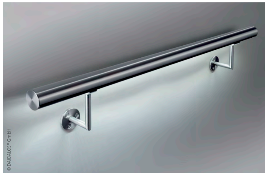
Wegweisend: beleuchteter Handlauf aus Edelstahl.

Autoren der ReduFix-Studien: Thomas Klie, Birgit Schuhmacher, AGP Sozialforschung | www.agp-freiburg.de