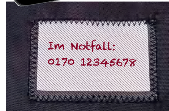
Little Helper für den Notfall: ein aktuelles Foto bereithalten und Infos in die Kleidung einnähen.

DIE GUTE NACHRICHT: Sogenannte körpernahe Fixierungen mit Bändern und Gurten kommen in der häuslichen Pflege eher selten vor. Zum Glück: Es ist nämlich besonders gefährlich, wenn pflegebedürftige oder demenziell verwirrte Personen mit Gürteln, Mullbinden oder Ähnlichem an Stühlen oder im Bett festgebunden sind. Häufiger kommt es vor, dass der pflegebedürftige Mensch zu