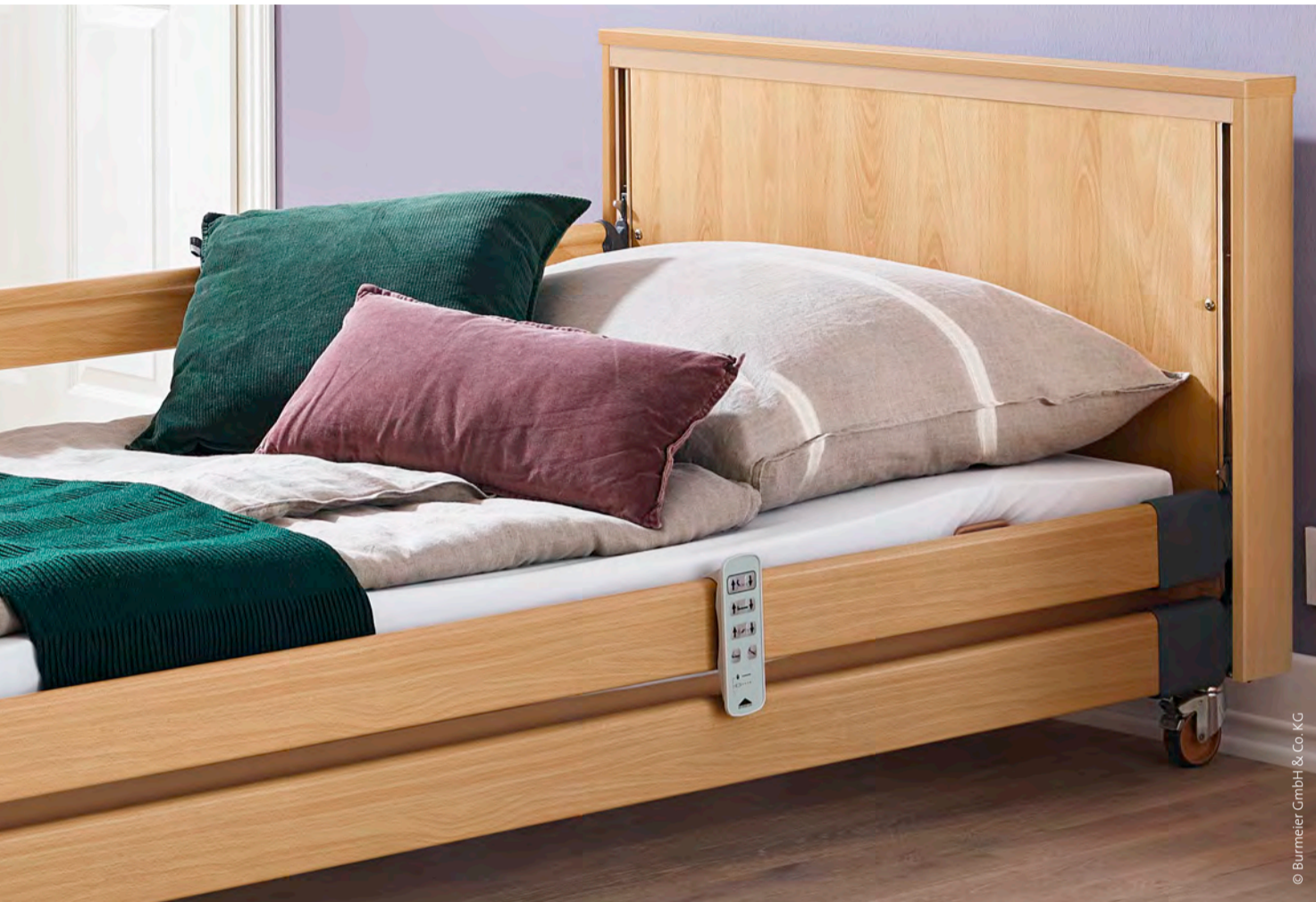
Niedrige Pflegebetten helfen, Stürze zu vermeiden.

Nicht zu überhören: Windspiele als freundlich-zuverlässige Signalgeber.