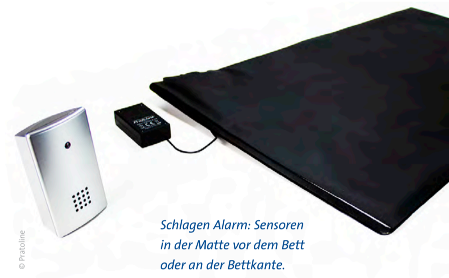
Schlagen Alarm: Sensoren in der Matte vor dem Bett oder an der Bettkante.