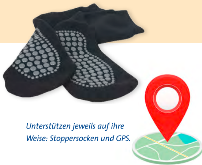
Unterstützen jeweils auf ihre Weise: Stoppersocken und GPS.