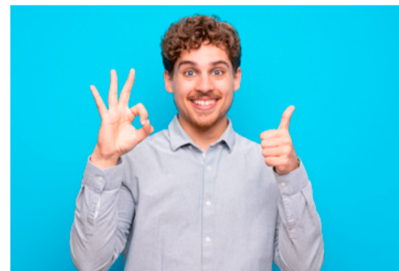
Pflegefachmann werden: Die Ausbildung beginnt am 1. August.

Fünf weitere Schüler:innen absolvieren ihre Ausbildung nach dem alten Ausbildungssystem zur Altenpflege. Wir haben weitere Ausbildungsplätze in Bötzingen, March, Umkirch und Gundelfingen.