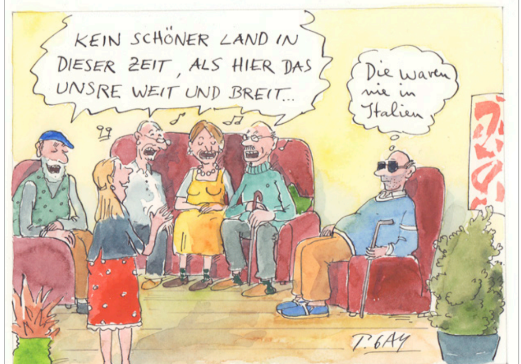
© Peter Gaymann, www.demensch.gaymann.de / Die Zeichnung stammt aus dem DEMENSCH-Kalender.