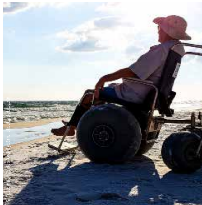
Mit einem speziellen Strandrollstuhl ganz nah ran ans Meer

Autorin: Sabine Anne Lück © Gepflegt zu Hause